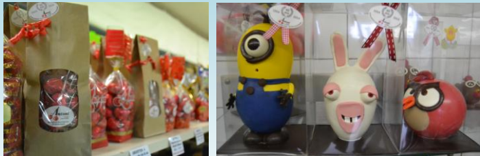
Des créations traditionnelles ...et des nouveaux sujets plus originaux !

Si leur spécialité, la griotte au kirsch d’Alsace a fait leur renommée et reste leur produit phare, c’est une palette variée de chocolats qui est présentée à notre gourmandise. Les maîtres des lieux ne se lassent pas de faire découvrir leurs créations des plus traditionnelles aux plus originales, toujours fabriquées avec le souci de la qualité et de l’équilibre des saveurs.