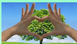
Agissons ensemble pour protéger l’environnement !

Des sacs et des gants vous seront remis, mais vous pourrez quand même prévoir des bottes et, si vous en avez, des pantalons étanches. Le rendez-vous est fixé à 7 h 45 aux étangs de pêche. Pour remercier les volontaires, une collation clôturera la matinée. On compte sur votre mobilisation pour préserver notre belle Bruche !