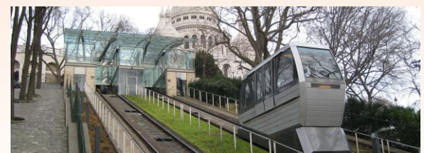
A Paris, le funiculaire de Montmartre permet d'accéder à la butte et à la Basilique du Sacré Cœur.

Afin de développer d'avantage l'attrait touristique du village, et peut être créer à long terme une nouvelle zone de résidences, le conseil municipal a reçu l'entreprise F. LABBE qui lui a présenté un projet novateur et très intéressant. Compte tenu de la structure du ban communal et des dénivelés parfois importants, plusieurs parcelles ne sont pas exploitées sur la colline. L'idée était de les rendre accessibles et d'y créer un centre d'intérêt. Le projet exposé consisterait à implanter un funiculaire de la rue de la Croix jusqu'en haut de la colline. Il s'agira d'une remontée mécanique équipée de voitures circulant sur des rails en pente et dont la traction sera assurée par un câble pour s'affranchir de la déclivité du terrain. Ce mode de transport, rare en France, sera un attrait incontournable pour le tourisme. Le projet prévoit en outre la construction d'une auberge au sommet, qui offrira ainsi la possibilité de se restaurer en admirant le panorama ainsi qu'une boutique de souvenir. Un plus pour Avolsheim.