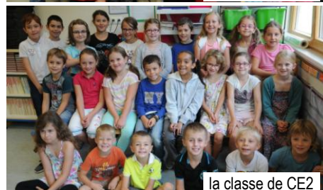
la classe de CE2