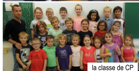
la classe de CP