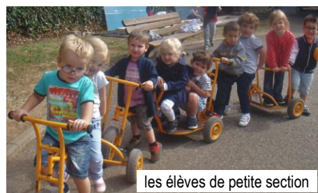
les élèves de petite section