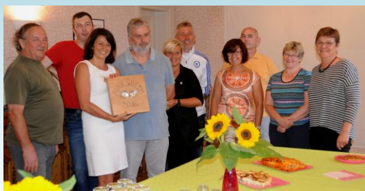
Une partie des membres de l'association réunis le 2 août pour fêter l'obtention de la 2 ème fleur

L'Assemblée Générale constitutive a regroupé, le lundi 29 août dernier, les membres fondateurs de l'Association des Amis d'Avolsheim. Les bénévoles qui s'occupent depuis quelques temps de la décoration et du fleurissement d'Avolsheim ont ainsi décidé d'officialiser les choses et de créer leur association. Celle-ci a pour but l'embellissement de la commune, l'amélioration du cadre de vie, la valorisation du patrimoine, le bien-être partagé et la promotion du tourisme.