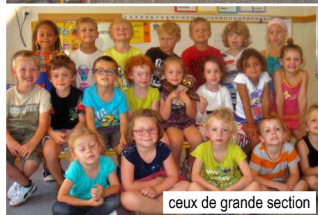
ceux de grande section