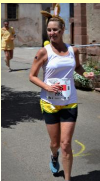
Pips lors du marathon en 2014

Mais comment diable ont-ils connus notre village ? Originaires de Perth en