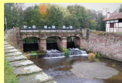
Les petites vannes

Mais le volume d'eau de la Mossig, qui devait alimenter le canal, se révéla insuffisant... Aussi, il fut décidé de détourner la Bruche vers le déversoir d'Avolsheim. C'est ainsi qu'en 1682 fut creusé le canal de Champagne, baptisé ainsi car creusé par le régiment de Champagne. Les vannes furent édifiées au même moment !