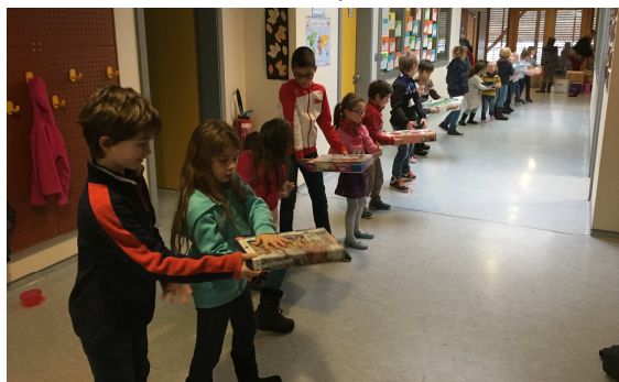
La chaîne de solidarité formée par les enfants

Les lutins verts du secours populaire sont à nouveau passés à l'école pour récupérer nos anciens jouets. Ces derniers pourront ainsi avoir une nouvelle vie et rendre heureux les enfants dans le besoin : Un Happy Noël pour tous les enfants grâce à la générosité de tous ! Bravo, merci et à l'année prochaine !