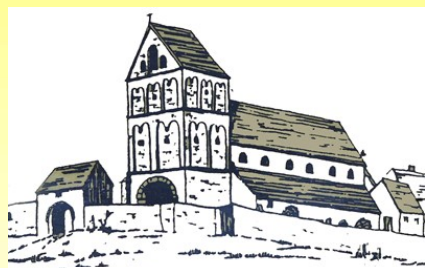
Le Dompeter avec la tour carrée de 1605

Une nouvelle église construite sur le même plan fût consacrée en 1049 par le Pape alsacien Léon IX. Un document datant de 1337 nous informe que le Dompeter devint l'église paroissiale de la ville Molsheim. Il perdit vraisemblablement ce statut lors de la Réforme protestante amorcée au XVI ème siècle.