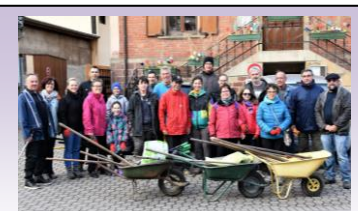
Merci aux participants de la journée citoyenne le 11 mai