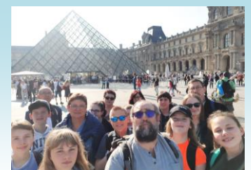
Le Conseil Municipal des Jeunes en visite à Paris