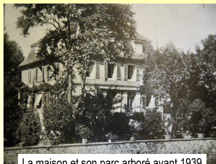
La maison et son parc arboré avant 1939