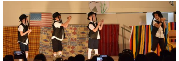
Après la présentation de leur spectacle,...