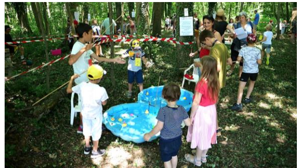
...les enfants ont pu faire les jeux de la kermesse dans la fraîcheur du petit bois attenant à l'école (photo ci-dessus) et faire un tour de poney sur la piste cyclable ombragée qui mène au Dompeter (ci-contre à gauche).