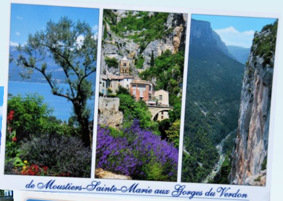
de Moustiers-Sainte-Marie aux Gorges du Verdon