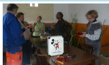
Une partie des bénévoles à l'action

Lors de plusieurs soirées bricolage, bouteilles, boîtes de conserves, canettes et autres déchets de la vie quotidienne ont trouvé une seconde vie, dans la bonne humeur, grâce aux mains travailleuses de nos bénévoles. A coups de découpage, de peinture, de vissage, de collage, avec beaucoup d'idées, de savoir faire et de talent, la décoration entièrement recyclée a pris forme. Elle a été posée en même temps que la plantation des fleurs, aux endroits stratégiques du village, par ces mêmes bénévoles. (voir photos dans le bandeau en haut de la page)