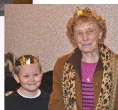
Les fêtes ont désigné le roi et la reine du jour