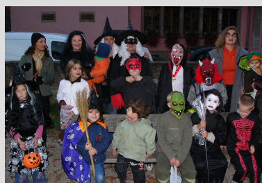
La même bande avait déjà sévi en 2006

Fort heureusement, on ne déplore aucune victime puisque les sinistres créatures se sont finalement contentées de bonbons et autres friandises.... On l'a échappé belle !