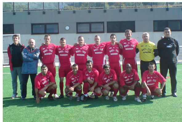
L'équipe fanion en 2007/2008

Les matchs des équipe 2 et 3 ont lieu le dimanche matin, ceux de l'équipe 1, le dimanche après-midi ; les vétérans jouent quant à eux, le vendredi soir.