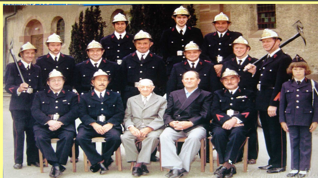
L'Amicale des Sapeurs Pompiers en 1981

La vocation de l'amicale est de permettre aux sapeurs-pompiers de se retrouver dans un cadre convivial, en dehors des interventions et formations inhérentes à la vocation de sapeur-pompier volontaire.