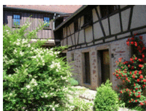
Le jardin intérieur