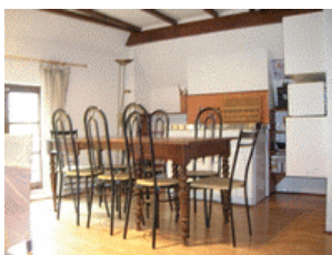
La cuisine du Gîte des Loups

Blottie derrière le Baptistère, bordée par la Bruche, se cache cette magnifique maison vigneronne du XVIIIème siècle. Entièrement réhabilités et rénovés, ses 2 chambres d'hôtes et ses 4 gîtes pour 2 à 12 personnes vous enchanteront. Cuisines équipées et salles de bains luxueuses assurent un confort maximum.