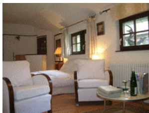
La Chambre du Coq