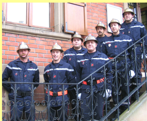
Les pompiers d'Avolsheim en 2008

La vocation de l'amicale est de permettre aux sapeurs-pompiers de se retrouver dans un cadre convivial, en dehors des interventions et formations inhérentes à la vocation de sapeur-pompier volontaire.