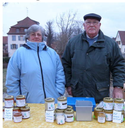
Au Marché d'Avolsheim, bien sûr!