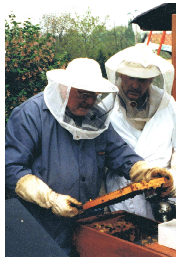
Contrôle d'une ruche et de son couvain.

Le miel d'Acacia , miel de table très doux / peut être utilisé pour sucrer les biberons.