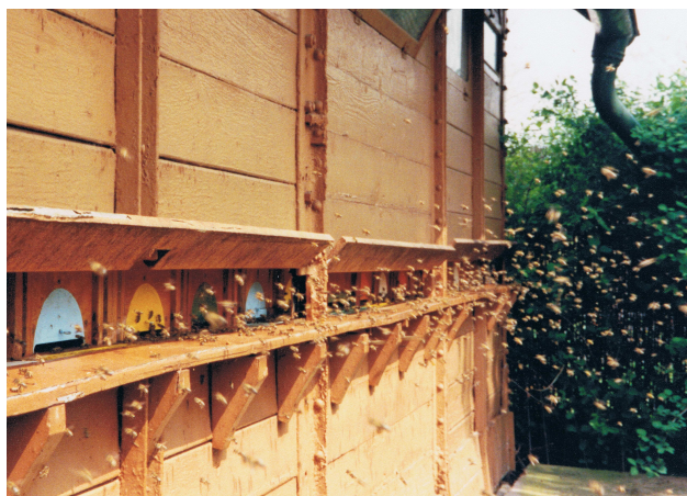
Le Rucher au fond du jardin.

Tout au long de l'été, les cadres gorgés de miel -que les abeilles auront recouverts d'une couche de cire- seront retirés de la ruche et remplacés par des cadres vides que les « ouvrières », si le temps est clément, rempliront à nouveau de miel en une semaine !