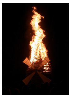
Feu de la St Jean 13 juin