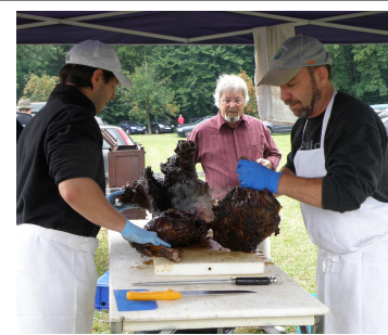
Sanglier à la broche au Dompeter le 12 juillet