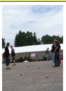
Tournoi de boules 12 juillet