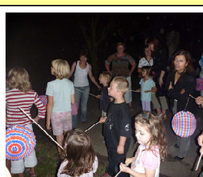
Défilé aux lanternes lors de la soirée champêtre du 13 juillet