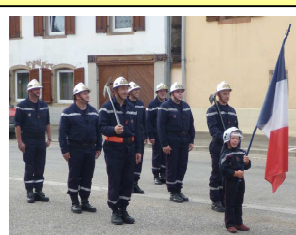
Le corps des pompiers commémoration de la Fête nationale 13 juillet