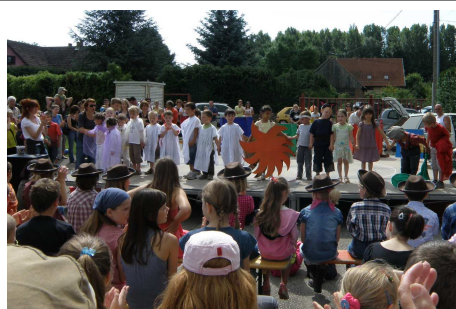
Fête des écoles du RPI au stade Spectacle des maternelles - 20 juin