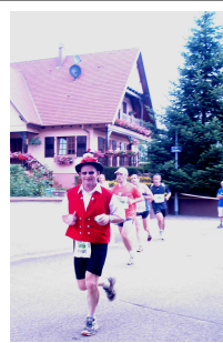
Marathon du vignoble 21 juin