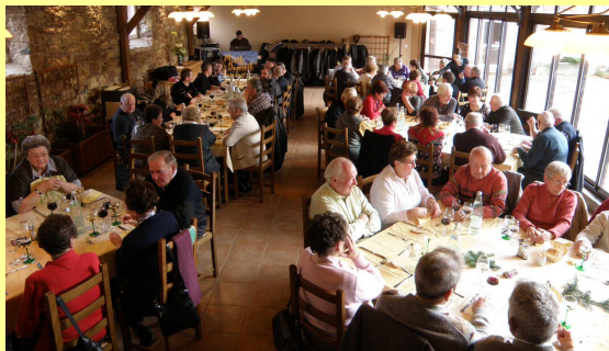
Le repas s'est déroulé dans une belle salle