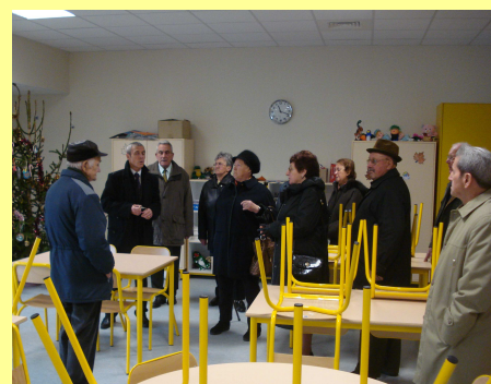
Le maire commente la visite de l'école pour un groupe

Merci à toutes et à tous pour cette journée et à l'année prochaine.