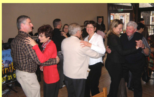
Certains ont effectué quelques pas de danse