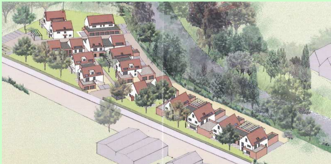
Perspective permettant d'apprécier l'insertion du projet de construction dans son environnement

Ce quartier résidentiel, qui comptera 40 logements, sera composé de maisons accolées et de petits immeubles « duplex-jardins ».