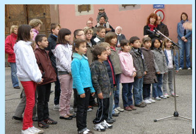
les élèves ont interprété la Marseillaise, puis le chant des partisans.