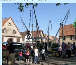
Il y avait foule au trampoline.

Le FCA tient à remercier les villageois, les exposants et les bénévoles qui ont contribué au succès de cette journée.