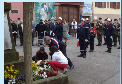
le Maire et 2 enfants déposent une gerbe au pied du monument aux morts