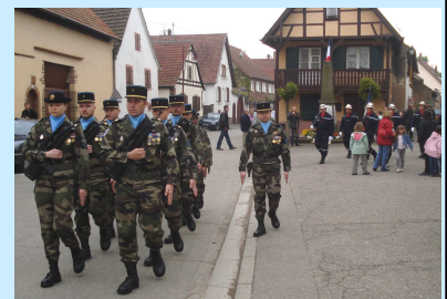
le détachement du 44 e RT

La cérémonie s'est clôturée par le verre de l'amitié partagé devant la mairie.