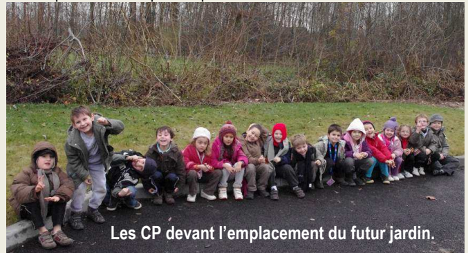
Les CP devant l'emplacement du futur jardin.

Les CP ont réfléchi sur 3 plans pour le potager et le jardin des senteurs, puis ils ont élaboré 3 maquettes à l'échelle 1/15 ème . Vous pouvez venir les admirer et voter pour votre jardin préféré (hall d'exposition de l'école). Le jardin qui obtiendra le plus de voix, sera réalisé par les CP au printemps.