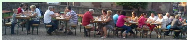
Soirée champêtre du 13 juillet