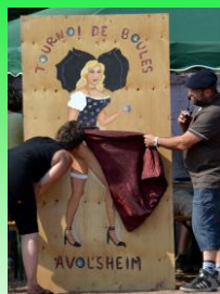
Concours de boules