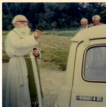
La bénédiction en 1981...

C'est à l'issue de la grand-messe, célébrée ce jour-là en l'Eglise du Dompeter, et à l'occasion de la Saint Christophe, considéré comme le saint patron des voyageurs et des automobilistes, que la bénédiction a été délivrée aux véhicules qui se sont présentés devant le prêtre.