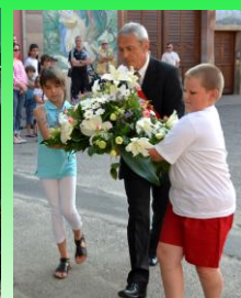
Célébration 14 juillet