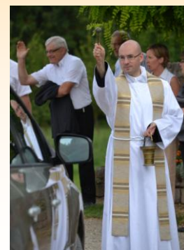
...et en 2013.