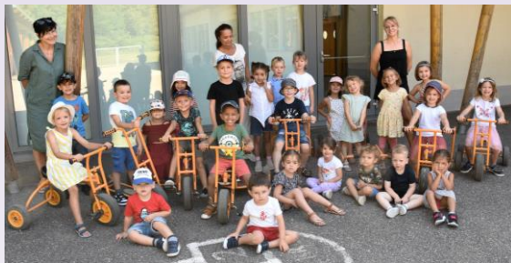
La classe des maternelles

Cette année, le RPI compte 124 élèves répartis ainsi :