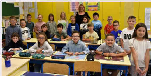
La classe des CE2-CM1