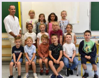
La classe des CP